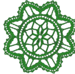
Variante 2 (Nr. 1 und 2 in Vorlage)